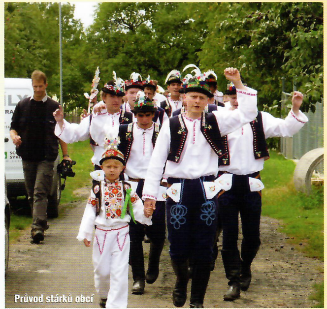
Průvod stárků obcí