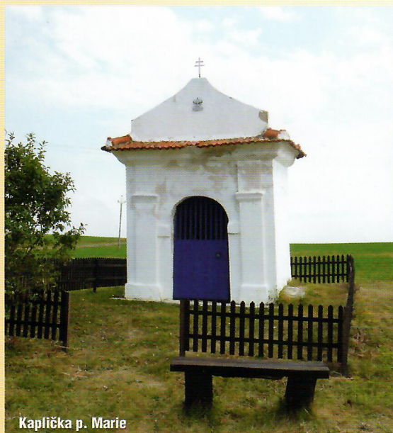
Kaplička p. Marie