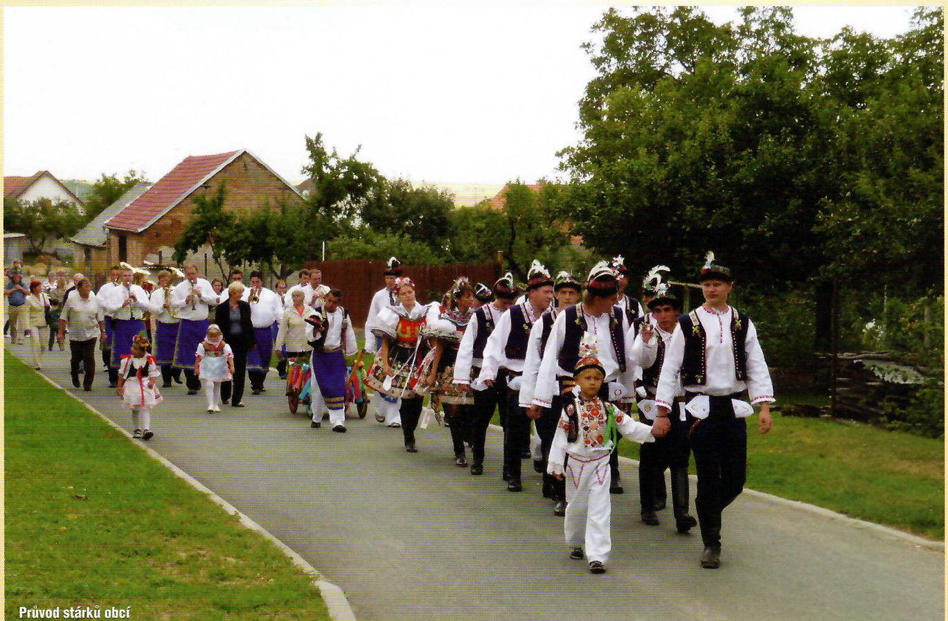
Průvod stárků obcí