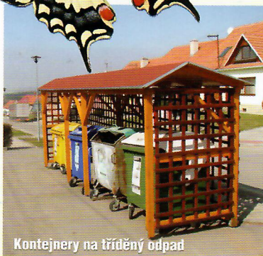
Kontejnery na tříděný odpad