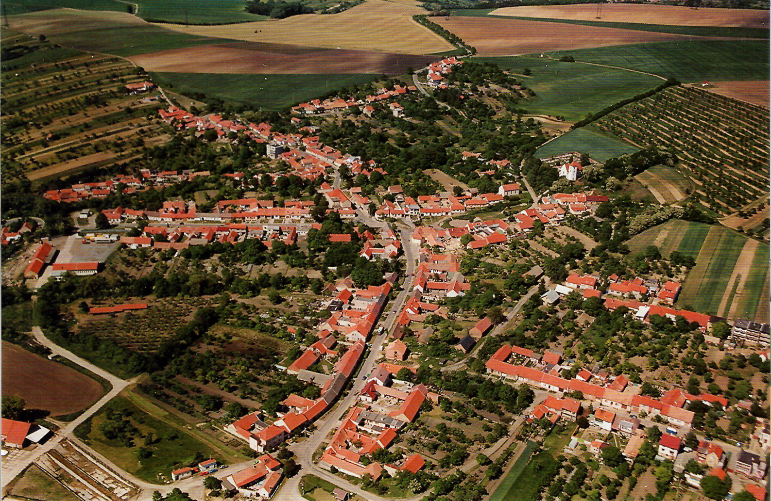
Jako na dlani – letecký pohled na Kobeřice ▲