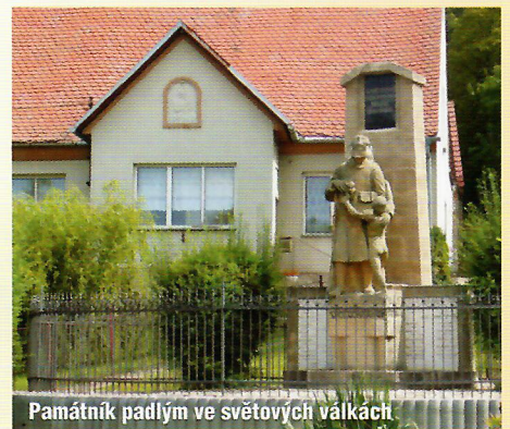
Památník padlým ve světových válkách