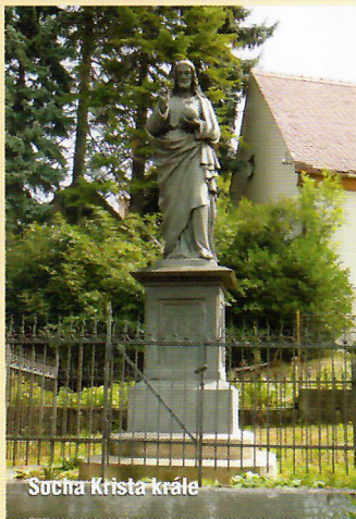
Socna Krista krále