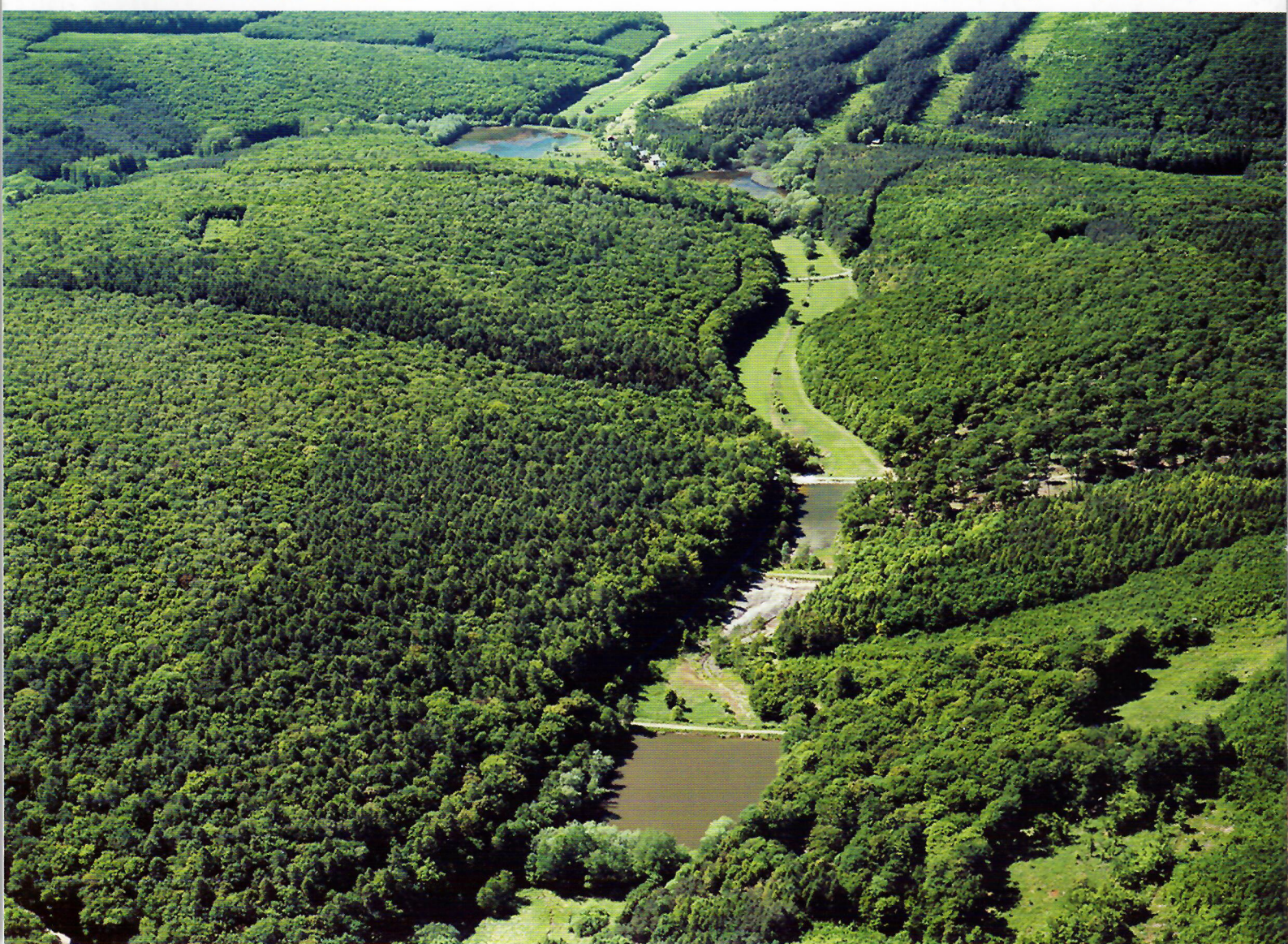
▼ Kaskáda rybníků na jih od Kobeřic