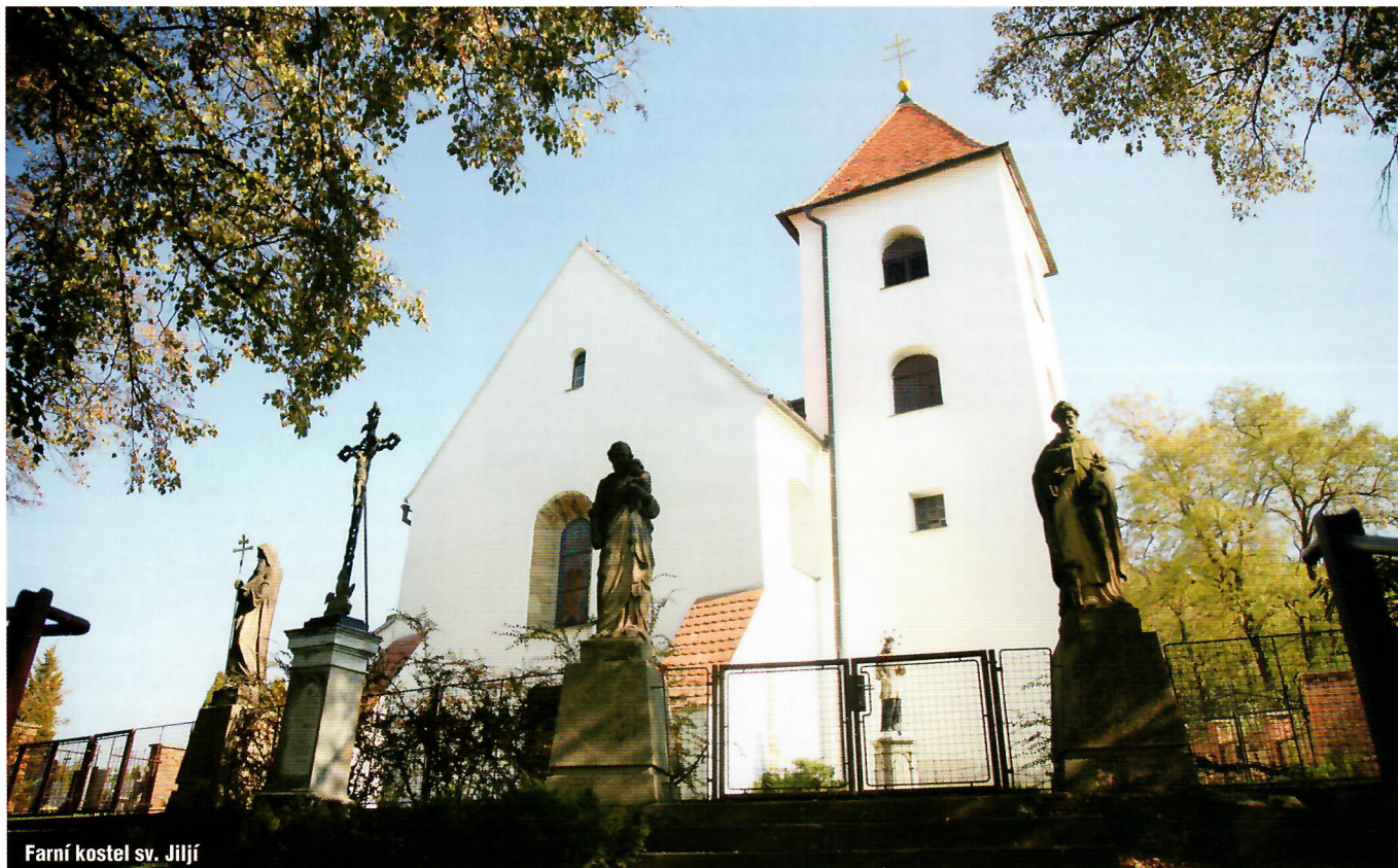
Farní kostel sv. Jiljí