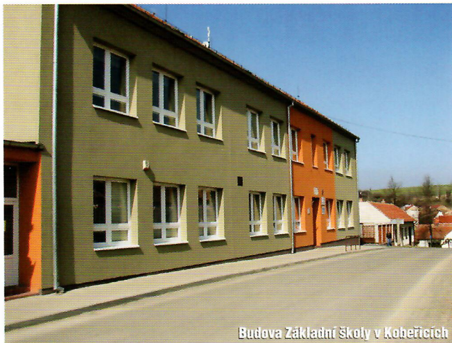
Budova Základní školy v Koberžicích