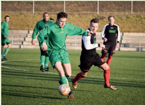
Přípravné utkání proti Měninu

Fotbalisté našeho A-týmu doplněni o zástupce B-týmu i dorostu se i letos, jako již tradičně, zúčastnili zimního soustředění v Rudce u Kunštátu. Zde absolvovali několik tréninkových jednotek včetně přátelského utkání s mužstvem z nedalekého Kunštátu. K náročným tréninkům samozřejmě patřila i regenerace, nejen na hotelu, ale i na bazénu v Boskovicích, kde si hoši užili saunu a vířivku. Lednová příprava určitě neprobíhala podle plánů, příčinou byla především nízká účast na trénincích a ani po zmiňovaném soustředění se toho bohužel moc nezměnilo. Bídou přípravu pak podtrhly výsledky z přípravných utkání, ve kterých se naše mužstvo utkalo s Měninem, Dražovicemi, Dambořicemi a Žarošicemi a uspět dokázalo pouze jedinkrát. V nezměněné sestavě se hráči A-týmu představili při prvním jarním soutěžním zápase