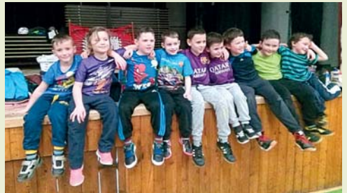
Kluci z přípravky jsou skvělá parta

v Nikolčicích a výkon rozhodně neodpovídal těm, jenž celý tým předváděl po celou zimu. Domácí tým sice zvítězil 2:0, ale nebýt našich neproměněných šancí, výsledek mohl vypadat úplně jinak. Ani dorostu se napoprvé na hřišti příliš nedařilo, dostali od soupeře z Rousínova rovnou 7 gólů. Pouze B-mužstvo naskočilo do sezóny opět vítězně, když z Habrovan odjízďelo s výsledkem 2:6.