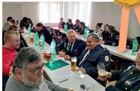
V lednu se uskutečnila valná hromada dobrovolných hasičů

Tento rok se omlouváme všem, ale z pracovního vyčerpání všech vedoucích nejsme schopni zabezpečit výběr peněz v rámci Českého dne proti rakovině. Květinčky si prosím 15. května zakupte u jiných prodejců a podpořte tuto skvělou sbírku. Slibujeme, že příští rok se děti opět rozeběhnou po našich ulicích. ■