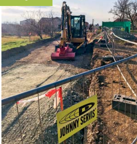
Probíhající rekonstrukce ulice U hřiště

Kulturní život v obci byl opět velmi pestrý a další akce nás ještě čekají. Chci poděkovat maminkám, že se opět ujaly dětského maškarního plesu a musím říct, že se mi tento zvolený formát moc líbil. Setkání seniorů bylo letos opět hojně navštíveno a byl připraven velmi zajímavý program. Lucka Horňáková zprostředkovala našim seniorům seminář, ve kterém se učí práci na počítači. Slyším velmi pozitivní ohlasy, což je dobře a Luce patří poděkovat. I přes deštivé počasí se letos opět vydal zabijačkový kotlík. Ty časy, kdy se konaly zabijačky takřka v každé domácnosti, jsou dávno pryč a oblíbené teplé pochutiny, či čerstvé výrobky jsou prostě vzácnost. Pomalu se blíží