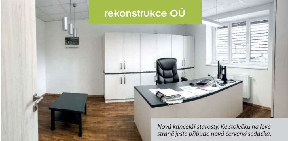
Nová kancelář starosty. Ke stolečku na levé straně ještě přibude nová červená sedačka.