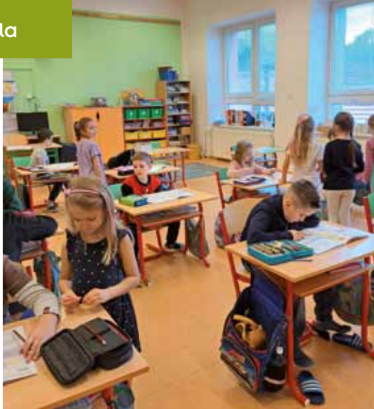
Předškoláci na návštěvě ve škole