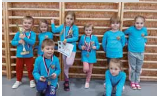
Družstvo přípravy na soutěži v Těšanech

V lednu si mladí hasiči dali závodní pauzu a poctivě trénovali uzlování, aby byli připraveni do Těšan na uzlovku. Trénink se vyplatil. Přípravka si odvezla 1. a 3. místo, mladší hasiči byli na 3. místě a starší hasiči obsadili krásnou 2. příčku. ■