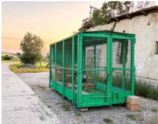
Velkokapacitní kontejner na papír je k dispozici na konci ulice Vrchní

Další možnosti, které jsme dosud měli k dispozici – nadále zůstávají k využití: v obci máme rozmístěny velké kontejnery na plast, papír (je vhodné co nejvíce využívat především klecový kontejner u bývalého družstva), kontejnery na bioodpad, před obecním úřadem je nádoba na olej a tuky, kontejner na šatstvo. To, že se objem odpadů má vždy před vhozením do kontejneru minimalizovat, například sešlápnutím PET lahve, nebo rozložením papírové krabice, se rozumným lidem připomínat jistě nemusí. Je určité na místě zmínit také občanům velmi užitečnou službu = sběr železného šrotu a elektrozařízení – který v naší obci pořádá na podzim TJ Sokol Kobeřice a na jaře jednotka sboru dobrovolných hasičů. Kdykoliv v průběhu roku je možné využít služeb sběrného dvora ve Slavkově u Brna. Pro občany Kobeřic je zde možnost uložit bez poplatku bioodpad, elektrozařízení, nebezpečný odpad (plechovky od barev, rozpouštědla, motorové a fritovací