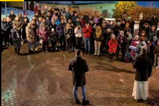
Setkání pod vánočním stromem