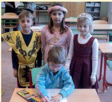
Budoucí prvňáky u zápisu provázeli školáci.

Od pondělí 25. do středy 27. dubna bude probíhat zápis do MŠ. Všechny tři dny budou moci přijít děti i s rodiči vždy mezi 9 a 11 hod, ve středu pak také odpoledne od 15 do 16.30 hodin.