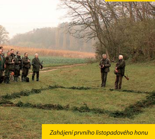
Zahájení prvního listopadového honu