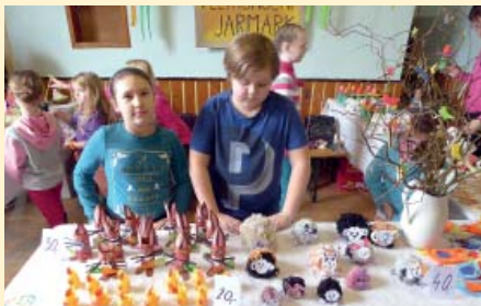
Školáci na velikonočním jarmarku prodávali své výrobky.

Druhou březnovou sobotu sokolovna hostila pestrý jarmark s ukázkami tradičních řemesel. K vidění a vyzkoušení byly různé styly výroby kraslic, skleněné ozdoby,