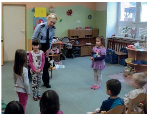
Paní poručice vysvětluje dětem, jak správně přecházet silnici.