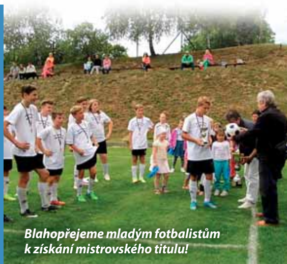
Blahopřejeme mladým fotbalistům k získání mistrovského titulu!