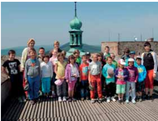
Děti a paní učitelky na vyhlídkové věži

Červnový výlet na pohádkový hrad Buchlov se povedl. Počasí přálo, sluníčko svítilo a nálada byla výborná. Prvním zážitkem bylo rozsvícení bodových světél v moderně zařízeném autobuse, když jsme projížděli temnými buchlovskými lesy. Děti užasly. Ovšem zábava a aktivity byly připraveny až po příjezdu na hrad. Součástí prohlídky Buchlova byly pastelky a omalovánky, které tematicky provází a ilustrují historii hradu. Děti s nadšením poslouchaly, zájímaly se a kladly otázky. Celý výklad byl přizpůsobený malým návštěvníkům, ozvláštněn o pověsti týkající se hradu a průvodkyně byla oblečena do dobového kostýmu. Odměnou za výstup na nejvyšší