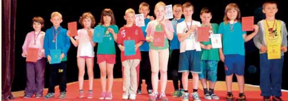
Medailisté ze všech školních kategorií.