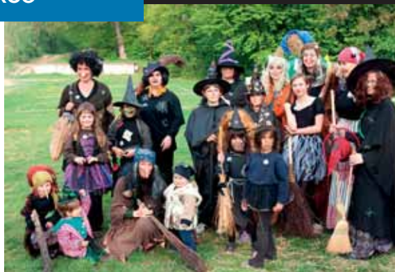
Všechny koberské čarodějnice se svými pomocníky