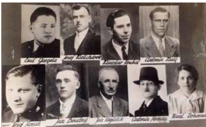
Oběti bojů o Kobeřice