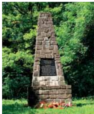
Památník partyzánům u Zlatého jelena